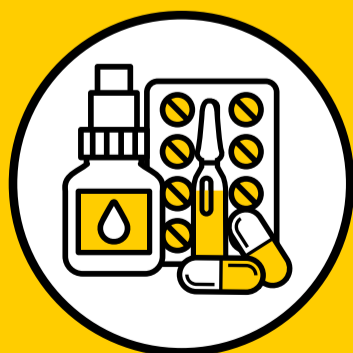
MEDICAMENTOS QUE NO NECESITAS